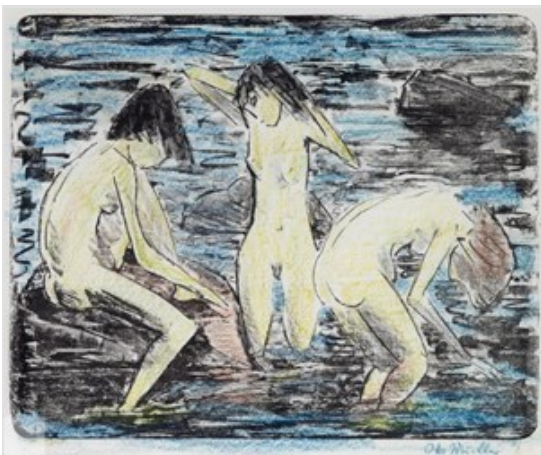
"Drei Badende", eine handkolorierte Lithographie (1928/30) von Otto Mueller gastiert bei der "Art & Antique" im Angebot von Kolhammer & Mahringer. Kostenpunkt für das Unikat? Unter 100.000 Euro.